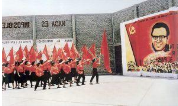
Prisioneras del penal Castro Castro, s/f.