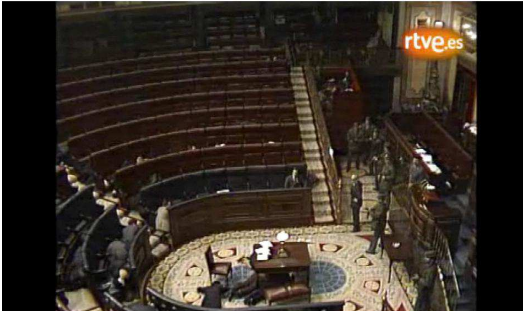
Imagen 2. 23-F de 1981.

la Constitución. La astucia de Armada, una traición.