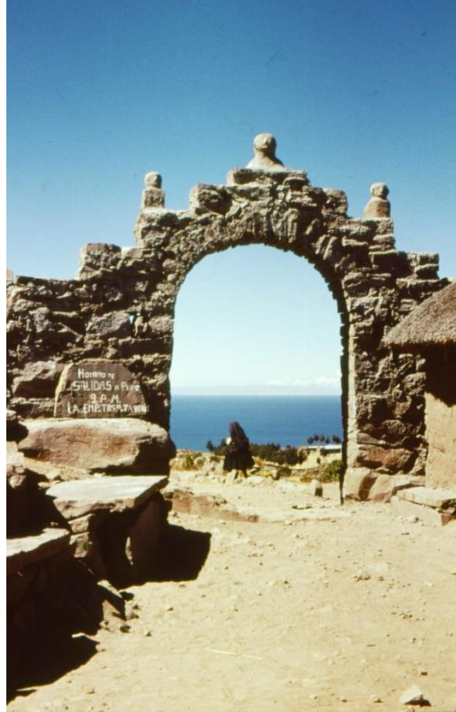
Foto 1. Portada de ingreso a la Isla Taquile en el Lago Titicaca, Puno, Perú.