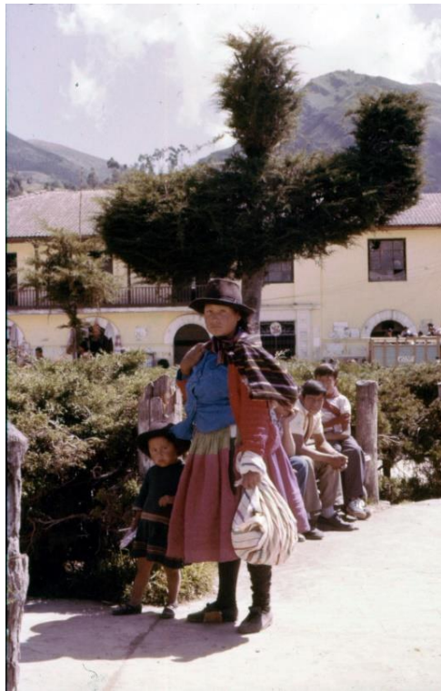
Foto 2. Campesina en la plaza de Tambo, Ayacucho, Perú.